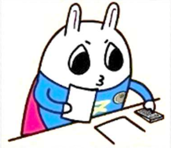
東京地方税理士会 イメージキャラクターの「トッチーくん」