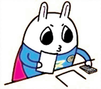
東京地方税理士会 イメージキャラクターの「トッチーくん」