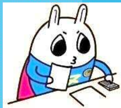
東京地方税理士会 イメージキャラクターの「トッチーくん」