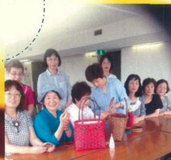
避難している者同士定期的に集まってものづくりを楽しんでいます